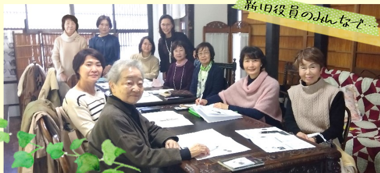
新旧役員のみんなと